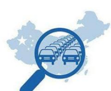
ΚΙΝΗΤΙΚΟΤΗΤΑ ΣΤΗΝ ΠΟΛΗ