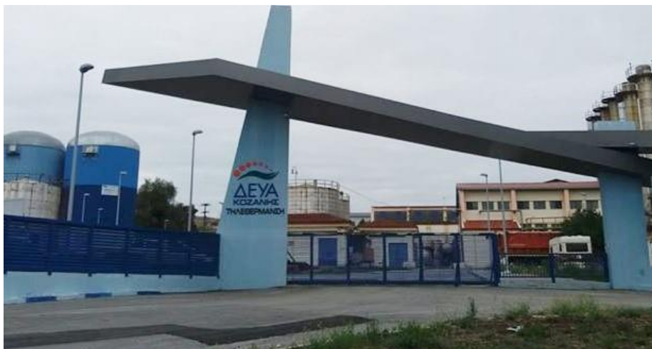
Οι εγκαταστάσεις της Τηλεθέρμανσης Κοζάνης