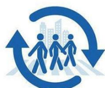
ΚΙΝΗΤΙΚΟΤΗΤΑ & ΚΟΙΝΩΝΙΑ

Η Στρατηγική Βιώσιμης Κινητικότητας της Κοζάνης υπηρετεί μια συνδυασμένη πολεοδομική και κυκλοφοριακή κατεύθυνση. Υπέρτατος στόχος είναι η ανάδειξη της ταυτότητας της πόλης και η συγκρότηση ενός περιβάλλοντος κοινωνικά συνεκτικού.