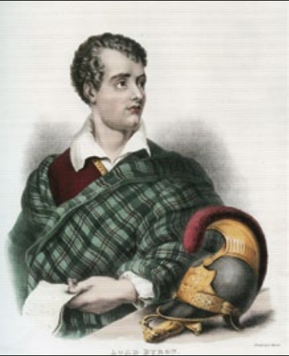
Ο φιλέλληνας Λόρδος Βύρων