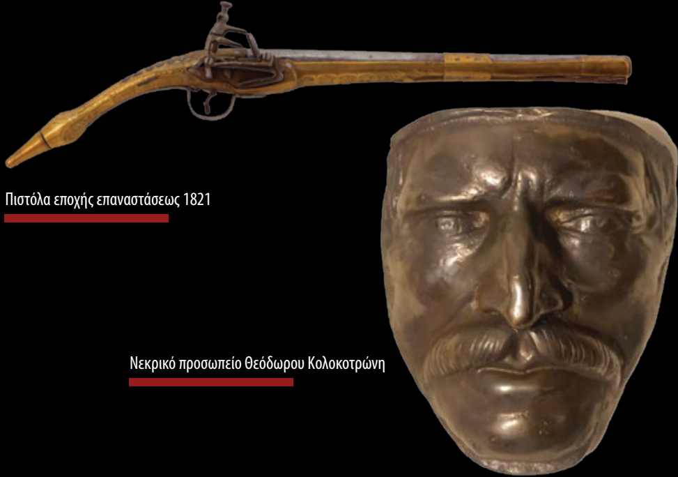
Πιστόλα εποχής επανάστσεως 1821