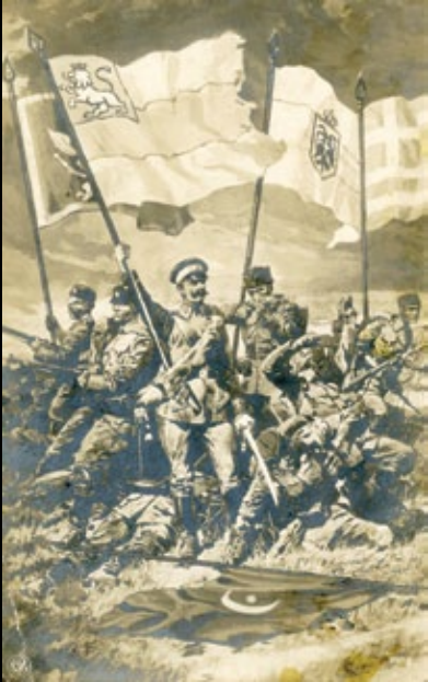
Α΄ Βαλκανικός πόλεμος, 1912