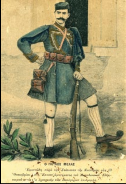
Ο Μακεδονομάχος Παύλος Μελάς