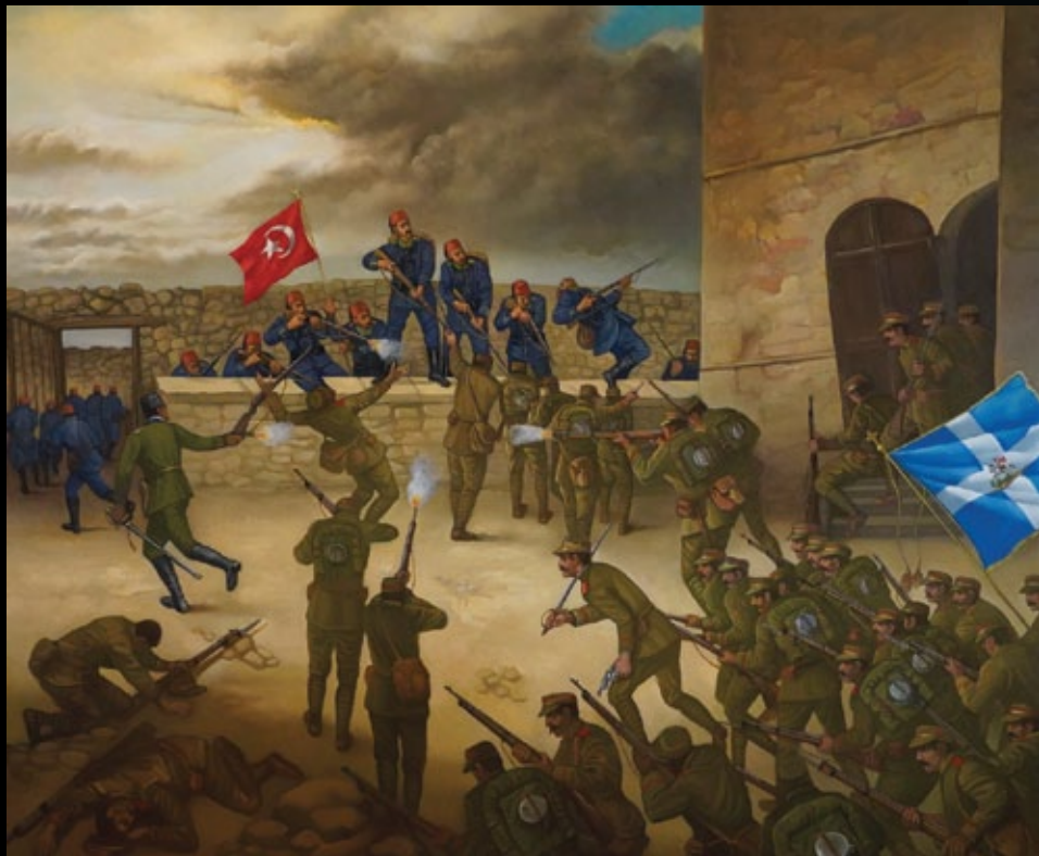
Η απελευθέρωση της πόλης των Γρεβενών , 1912

Η 13η Οκτώβρη αποτελεί για τα Γρεβενά ορόσημο θυμίζοντας σε όλες και όλους εμάς το τέλος της δυσβάσταχτης οθωμανικής κατοχής και την έναρξη της ανεξάρτητης ιστορικής πορείας του νομού. Η νικηφόρα προέλαση του ελληνικού στρατού στα βόρεια τμήματα της ελληνικής επικράτειας και κυρίως η νίκη στο Σαραντάπορο υπήρξαν καθοριστικές για την φθίνουσα παρουσία των τουρκικών δυνάμεων στην περιοχή και την τελική άτακτη φυγή τους. Μετά από αιώνες σκλαβιάς και υποτέλειας η πόλη παραδόθηκε στα χέρια των Ελλήνων κατοίκων της ανοίγοντας το δρόμο για την ένωση με την ελεύθερη Πατρίδα.